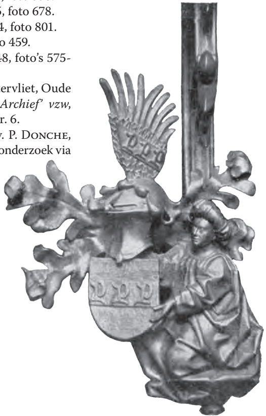
fig. 15. Balksleutel waarschijnlijk afkomstig uit Duitsland. (Afbeelding ontleend aan J. Kuiper: De heraldiek in bouwkunst en aanverwante vakken (Amsterdam, 1910), p. 23.)