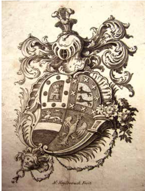
Eerste ex libris de Castro (VI. Frans Jozef jr.) (RAG, Fonds DDB, nr. 2527)

Een ex libris is een bezittersmerk ( ex libris meis (Lat.) = ‘uit mijn boekenverzameling’) en dus zeker geen bewijs van auteurschap van het boek of handschrift waarin het gekleefd is. Dit is zelfs hoogst uitzonderlijk het geval voor ex librisen gekleefd in gedrukte boeken van een verzameling: deze zijn bijna altijd geschreven door iemand anders dan de bezitter van een exemplaar ervan. Ook een in een handschrift gekleefd ex libris kan naar een bezitter verwijzen die niet de samensteller is van het handschrift.