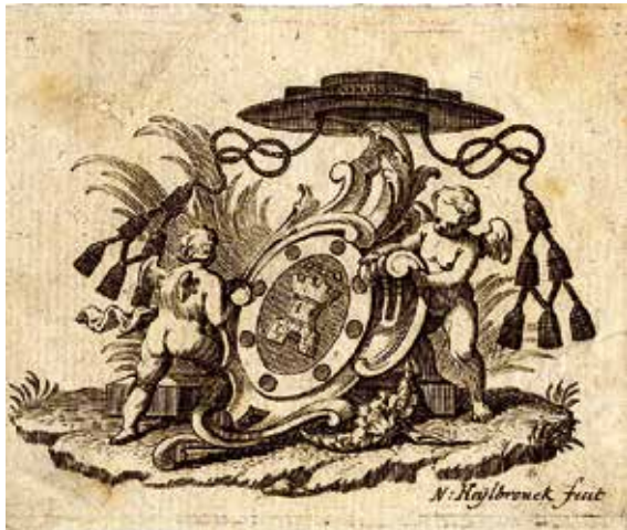
Derde ex libris de Castro (VI.bis.1. Jacob Antoon).

Maar is dit daarom doorslaggevend als bewijs? Voor LINNIG en GASTMANS blijkbaar wel. Maar hun conclusie blijkt te haastig te zijn genomen zoals overduidelijk blijkt