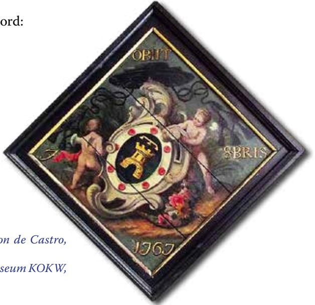
Rouwbord van kan. Jacob Antoon de Castro, heer van Sombeke. (Olieverf op hout, 89 x 89 cm, Museum KOKW, St.-Niklaas.)

Er valt niet naast te kijken, het is in al zijn details exact dezelfde voorstelling als het ex libris. Het vermeldt OBIT 7 8BRIS 1767: overleden op 7 oktober 1767.