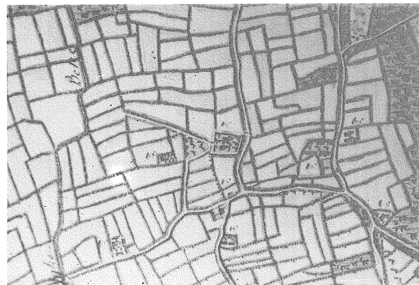
Detail van de Kabinetskaart van de Oostenrijkse Nederlanden van de Ferraris (1775). De vierkante omwalde hofstede is het Hildegemhof.

Misschien heeft de benaming iets te maken met de Zerkegembeek die de Vloethemveldweg kruist of iets meer zuidelijk met de beek die ontspringt bij deze straat en die heet : de « barlete » (18).