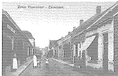
De Donze-Visser straat in Terneuzen

In de ons verstrekte afstamming tot 1800 vindt men de DONZE's terug te Terneuzen, Zaamslag en Hoek (deze laatste twee gemeenten resp. oost en west en beide grenzend aan Terneuzen). Dit blijkt op vandaag nog steeds de regio bij uitstek te zijn waar we Donze's terugvinden. Een lijstje van het aantal vermeldingen in de telefoongidsen toont volgende cijfers: Terneuzen: 20 en vervolgens (met de klok mee rondom Terneuzen): Vogelwaarde: 3, Zaamslag: 1, Spui: 1, Hulst: 1, Absdale: 1, Axel: 2, Sas-van-Gent: 4, Sluiskil: 1, Philippine: 1, Hoek: 5, en verder vinden we er nog enkele westwaart: Oostburg: 1, Breskens: 6, Vlissingen: 3, Middelburg: 4.