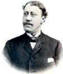
Arthur Merghelynck (Ieper, 1853 – Ieper, 1908)

De genealoog Arthur Merghelynck overleed dit jaar precies 100 jaar geleden. Dit wordt deze zomer passend herdacht met tentoonstellingen aan hem gewijd in het kasteel Beauvoorde (Wulveringem - Veurne) en het Stedelijk Museum Ieper 1 . Zijn bijdrage in de ontsluiting van historische bronnen, van belang voor de genealogie van families uit westelijk West-Vlaanderen kan nauwelijks overschat worden (zie verder). De genealogie van zijn eigen familie werd al in meerdere publicaties beschreven, maar met zijn kwartierstaat gebeurde dit vreemd genoeg nog nooit. We kunnen hem daarom allicht niet beter in dit tijdschrift herdenken dan door zijn kwartierstaat te publiceren 2 .