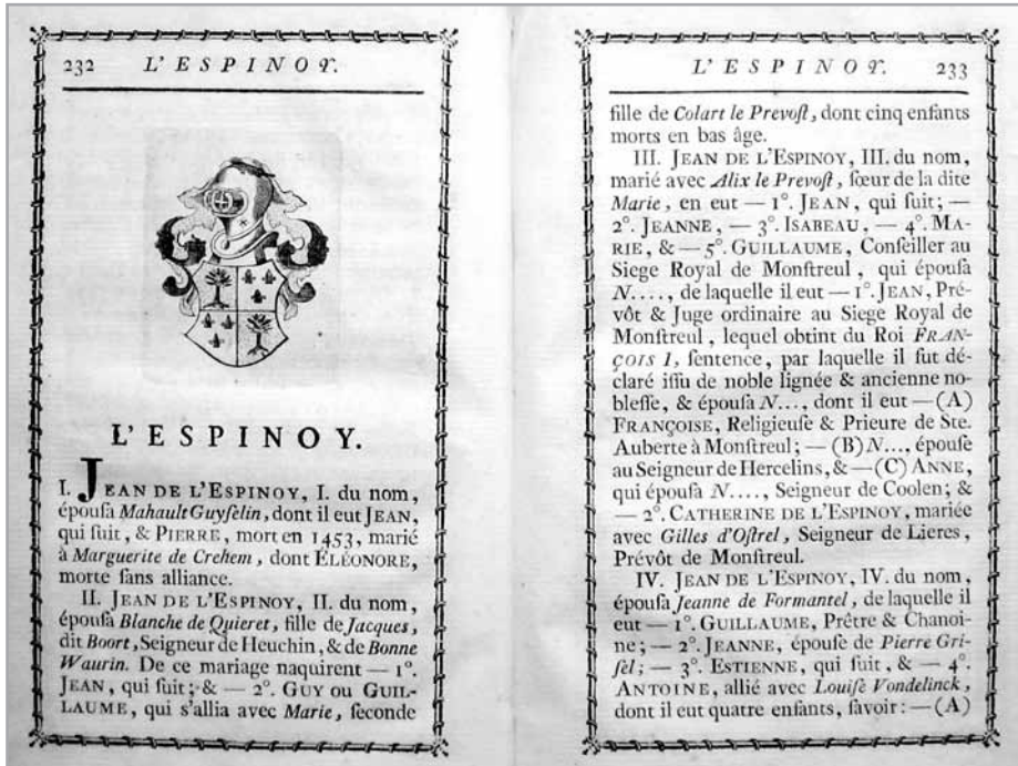
Eerste bladzijden van een gedrukte genealogie de l'Espinoy (de nachtegaal in het wapen lijkt weggevlagen ...)

wapens van aangetrouwden. De tweede komt voor in deel twee (samengesteld tussen 1777 en 1815) van zeven delen van de verzameling aangelegd door Ambroise-Jean-Ignace Ghys (Cassel, 1757 – na 1815). De derde, opgenomen in een verzameling van een groot aantal genealogische fragmenten of genealogieën is wellicht van Jean de Seur (griffier bij de Rijzelse Rekenkamer). 45 Een gedrukte genealogie (maar een graatgenealogie) werd in 1774 gepubliceerd in het verzamelwerkje Généalogies de quelques familles des Pays-Bas . 46