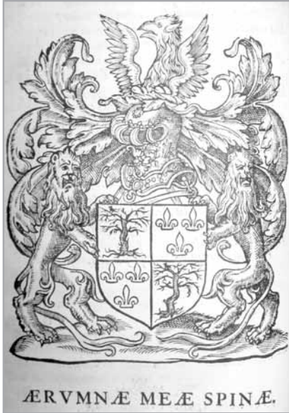
Wapen en wapenspreuk van Philippe de l'Espinoy (in: Recherches ... , p. 330)

Het handschrift KBR, II 2308, II tekent voor het 'oorspronkelijke' niet-gevierendeelde wapen een wapen die we in heraldische taal zouden kunnen omschrijven als: in goud een dorre boom met rechtsboven een vogel, alles van sable . Een eigentijdse blazoenering uit 1607 (akte van de schepenen van Ieper) blazoneert het wapen in de kwartieren 1 en 4 als: d'or avecq ung arbre despine de sable, pardessus ung rossignol de sable 34 , m.a.w. een doornboom overtopt door een nachtegaal. De nachtegaal staat dus soms rechts, soms in het midden boven de doornboom. Het gaat om een sprekend wapen: de doornboom verwijst naar Espinoy , Épinoy , vrgl. Fr. épine = doorn.