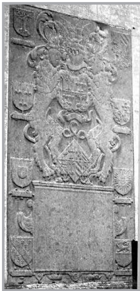
Grafmonument Charles de l'Espinoy en Margareta de Longin (kerk van Sint-Ulriks-Kapelle, in de noordelijke buitenmuur)

Het opschrift dat op het grafmonument te Sint-Ulriks-Kapelle werd aangebracht luidde: 19