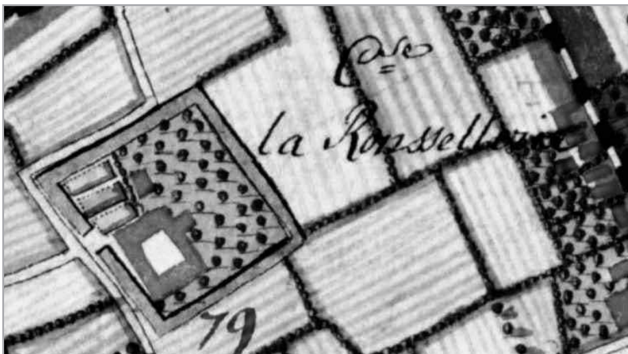
pal in het midden is de: C(en)se la Roussellerie