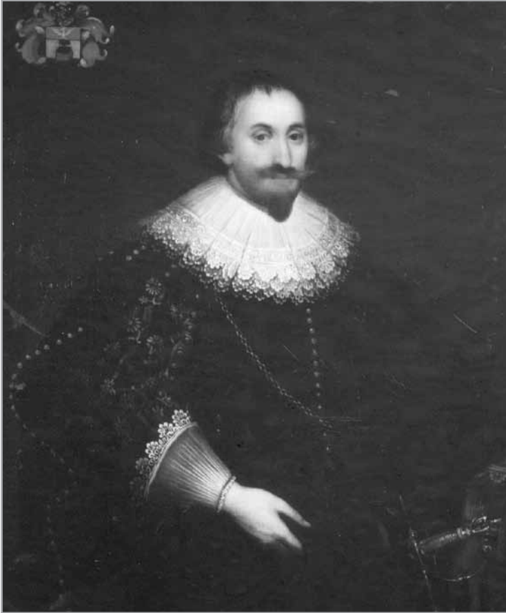
Portret van Pieter Cassetta

Als voogden van zijn twee minderjarige kinderen werden aangesteld: Jacob Anchemant, oud schepen van Brugge, Herman Ruteau en Bernard de Cras. In 1655 legde hun halfoom Inghelbert Cassetta de eed als voogd af. Zijn twee kinderen waren: 47