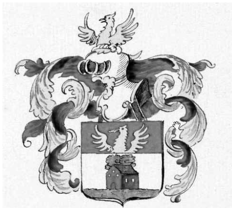
Familiewapen Casetta voor de wapenvermeerdering

wrong en dekkleden van goud, gevoerd van keel. Als helmteken: de uitkomende adelaar van goud van het schild.