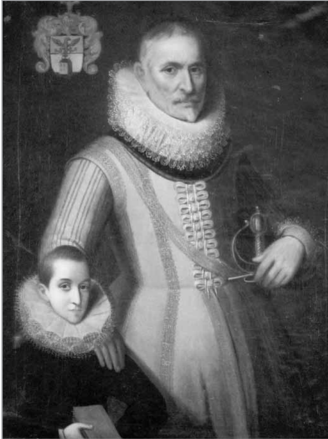
Portret van Marco Casetta, ca. 1604

van circa 1604. Marc Casetta draagt volgens de mode van zijn tijd een grote molensteenkraag afgewerkt met kant 30 en aan zijn linkerzijde een degen, een zgn. rapier . 31