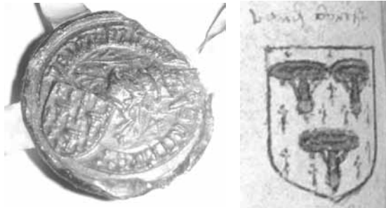
zegel van Achilles van der Burch, 1466 (RAB, SA Nieuwpoort, Burgerlijke Godshuizen, nr. 83) 7 en voorstelling familiewapen in wapenboek de Potter, ca. 1500 (SA Gent, AF 6724 f° 2v 6/8)

De familie van der Burch behoort tot de oudste Vlaamse geslachten. Al naar gelang de auteur gaat de afstamming terug tot 1286 of 1215. Vanaf 1720 droeg de eerstgeborene de titel van graaf, vanaf 1875 zelfs alle zonen en dochters. 6