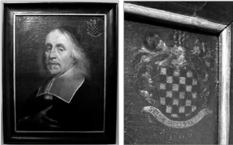
Portret en detail van het wapenschild van Pieter [III] Lootins Brugge, Algemeen Ziekenhuis St.-Jan, directiegang

Zijn geschilderd portret (520 x 420 mm) is bewaard in het Brugse St.-Janshospitaal. 36