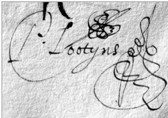
handtekening van Pieter [III] Lootyns (1631) SAB, Protocollen klerken Vierschaar , reg. nr. 870, f° 103.

Als schepen tekende hij ook diverse akten in de registers van de protocollen van de klerken van de Brugse Vierschaar, bv: 19