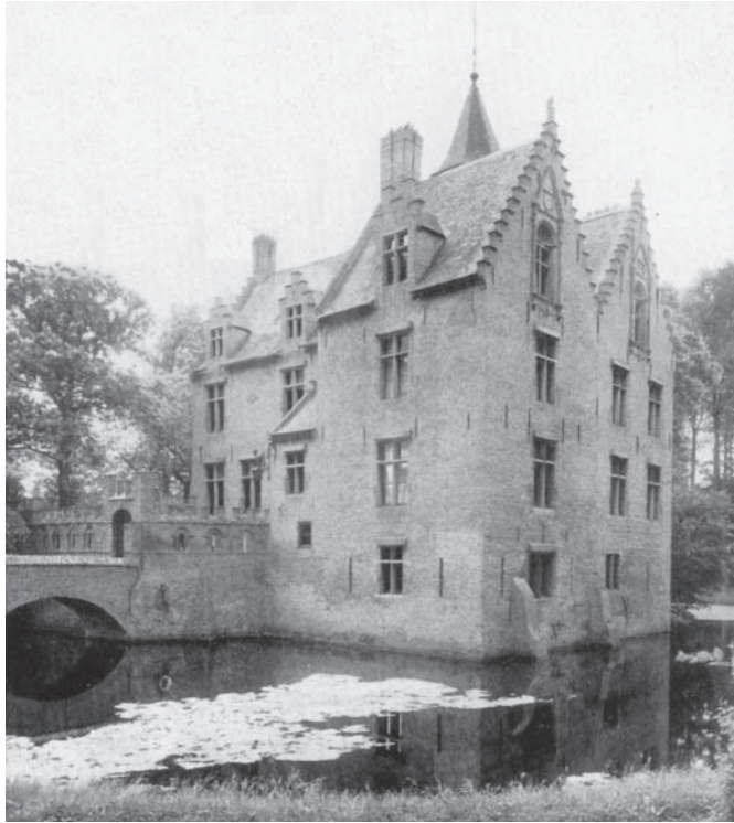
Kasteel Beauvoorde (Wulveringem-Veurne, 1591-1617)