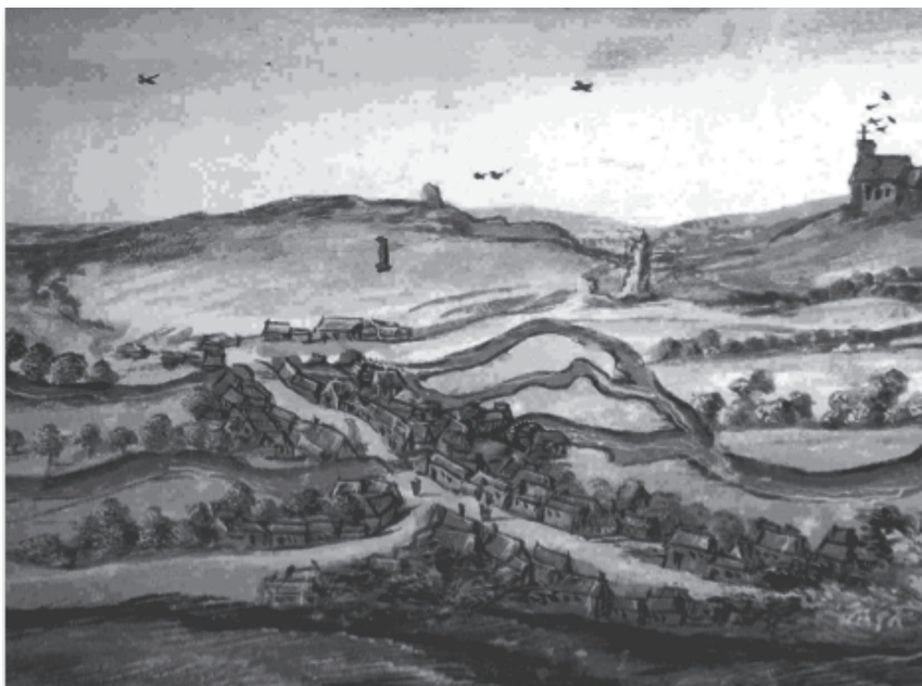
Terwaan na 1553

Op voorgrond de parochie Saint Martin-Outre-Eau, het huidige dorp Théroouanne. De kale heuvel linksboven is de plaats waar ooit de bisschopsstad Terwaan was. Tussen beide de Leie met enkele oude armen, rechts het kerkje van Clarques. Detail uit een aquarel uit circa 1610 in één van de albums van Karel van Croÿ.