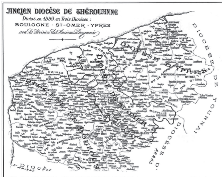
Het oude bisdom Terwaan met de grenzen van de drie nieuwe bisdommen gecreëerd in 1559.

Bij de oprichting van het nieuwe Ieperse bisdom werd de kerk van het St.-Maartens klooster (reguliere kanunniken van St.-Agustinus) tot kathedraal verheven. Het kathedraalkapittel bestond uit drie leden: het member van Terwaan: 10 prebenden overgebracht uit het afgeschafte bisdom Terwaan, het member van St.-Maarten: 12 prebenden (de reguliere kanunniken van het St.-Maartens klooster werden seculier) en het member van Veurne: 10 prebenden overgebracht vanuit het collegiaal kapittel van St.-Walburga Veurne.