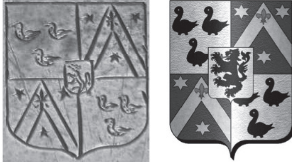
Afb. 8 en 9

We willen het nog even hebben over het familiewapen dat afgebeeld staat in de brede rand van de schotel (afb. 8) en dat er duidelijk als een eigendomsmerk in gegraveerd is. Dit wapen was nog niet geïdentificeerd op heden. 14