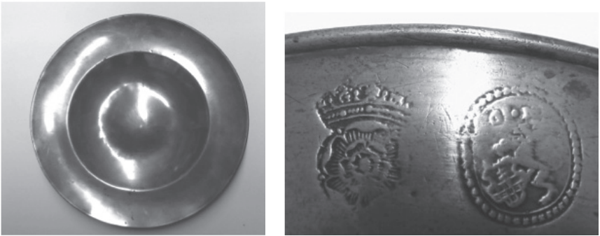
Afb. 4 en 5

In 'Tinnewerck' nr. 46 (januari 2010) onderwierp Jozef Dewulf deze merken aan een nauwgezet kritisch onderzoek en kwam tot het besluit dat het hier bijna zeker moest gaan om merken van een nog onbekende Ieperse tinnegieter met de initialen CM of GM . In juli 2005 was er al eens een kardinaalschotel uit Ieper beschreven, nl. in 'Tinnewerck' nr. 37. [afb. 4] Deze droeg dezelfde merken, maar hier kon men toch iets duidelijker zien dat de initialen waarschijnlijk wel GM waren. [afb. 5]