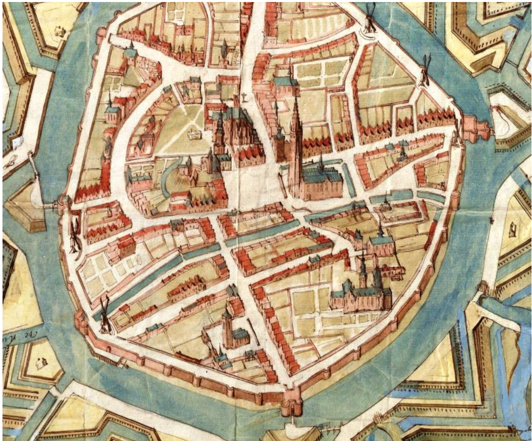
De watergang op een anoniem 18de-eeuws stadsplattegrond van Veurne (KBR, Hs. S. III, 5.459, 38,5 x 42 cm, detail)