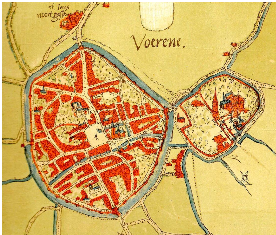
De watergang In de zuidelijke helft van de stad ca. 1565. (KBR, stadsplan van Veurne uit 1559-1572 door Jacob van Deventer)

Maar men zag af van een overwelfing omdat er door de slechting van de stadsvesten genoeg aarde voorhanden was om de gracht op te vullen. Dit geschiedde in 1685, het dempingswerk duurde nog tot in 1709. 11