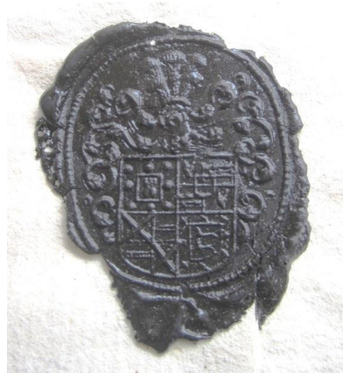
Handtekening en zwart lakzegel met wapen van Antoon Frans Jozef de Castro, 1736 (RAG, Archief St.-Baafs en Bisdome Gent, nr. 36.427)

We vinden het (erg complexe) wapen dat hij gebruikte op een lakzegel op een brief van hem vanuit Waasmunster van 7 februari 1736 2 : gevierendeeld: in 1: de Castro, in 2: de Hertoghe, in 3: de Villers, in 4: Lopez.