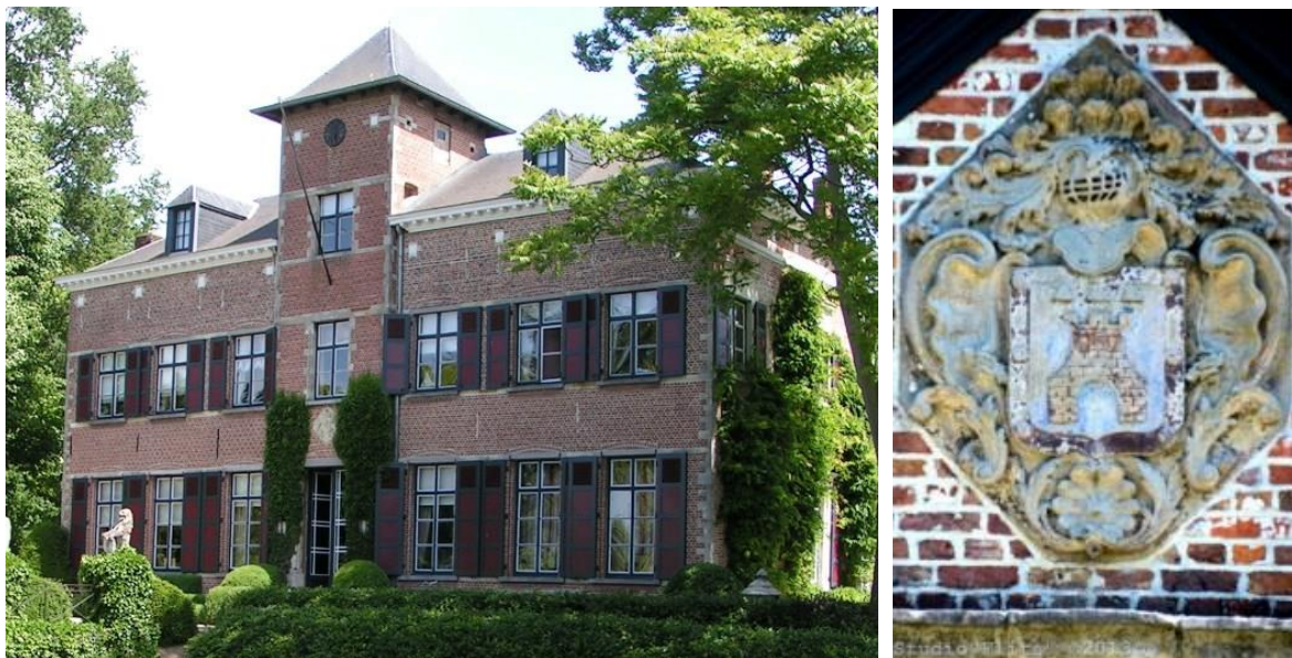
Kasteel van Sombeke te Waasmunster en wapen de Castro in het poortgebouw