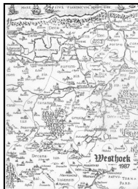
Jaarboek IV (1987)